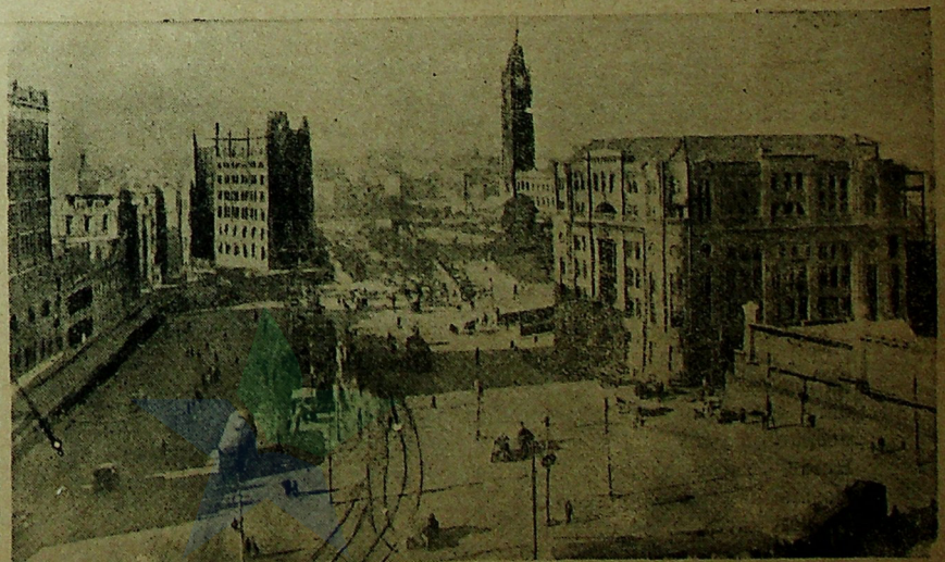
Pamandangan dari kota Sydney, Australie.

Satoe orang di Londen telah mendapat patent boeat gretan jang sebatangnja bisa digeret dapek api doea kali. Matjemnja dan pandjanganja tida beda dengan gre-