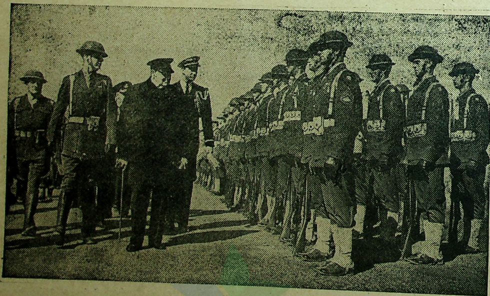
PREMIER CHURCHILL inspectie marine Amerika di Ijsland. Sehabis kombali dari pertemoannja dengan Roosevelt di Laet Atlantic, ia mengoendjoengi Reykjavik, iboe kota Ijsland. Pendoedoek Ijs- land memberi selamat dengan goembira kepadanya. Pada bangsa Ijsland Mr Churchill memberi taoe- perang nanti marika mendapat kombali kamerdika'annja seloelas-loeasnja. Dalem gambar ini kalia- tan; Mr Churchill ditemeni oleh FD Roosevelt Jr inspectie marine Amerika.

Boeat sekarang, kita toenggoeken apa jang aken terdjadi dengan hati tetep.